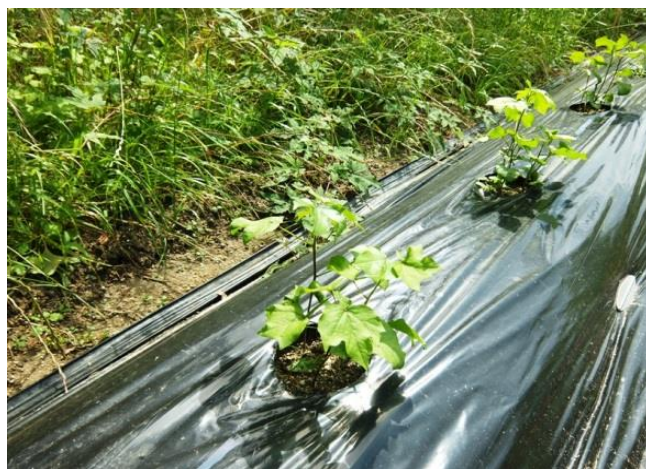
旧北高安小グラウンドでの栽培