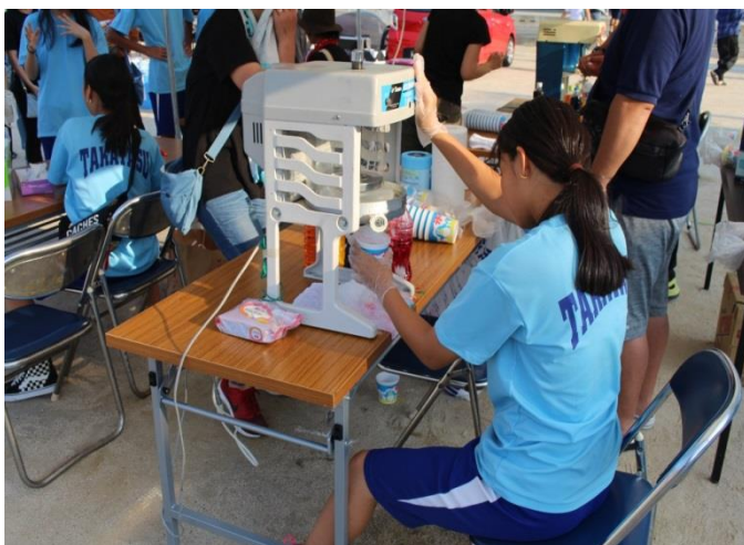
模擬店の様子（中学生も運営に協力しています）