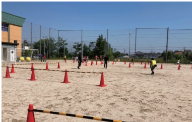
高安ミッション(支援)