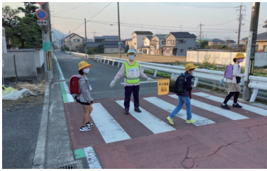
子ども見守り活動