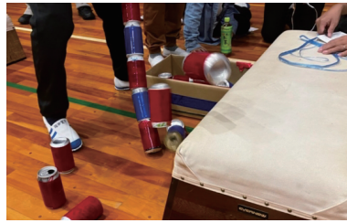
子どもオリンピック(支援)