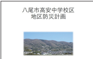
八尾市高安中学校区 地区防災計画