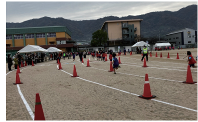
高安の里マラソン大会(支援)