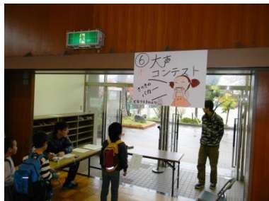
子どもオリンピック