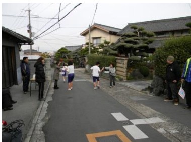
高安の里マラソン大会